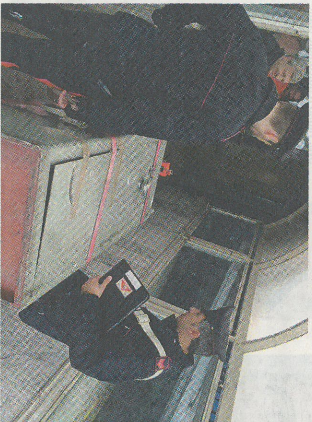
La cassaforte che i ladri hanno tentato di portare via all'Agenzia delle Dogane in via Galilei