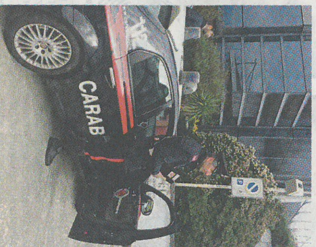
Sul furto di via Galilei indagano i carabinieri di Bolzano

sono accorti dell'arrivo delle forze dell'ordine e hanno immediatamente abbandonato la cassaforte che stavano trasportando a fatica. Ovviamente i militari dell'Arma hanno avviato le in-